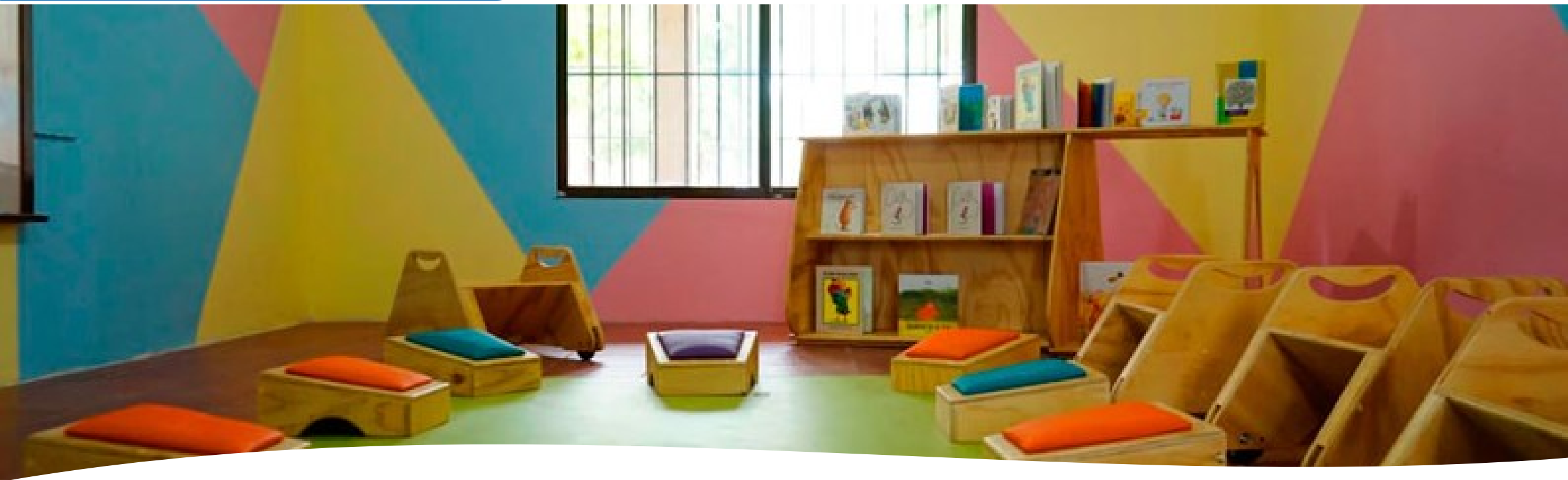
Sala de Lectura Sabanagrande, Atlántico