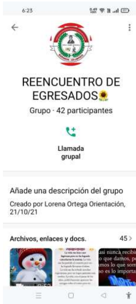
Comunicación e interacción con egresados