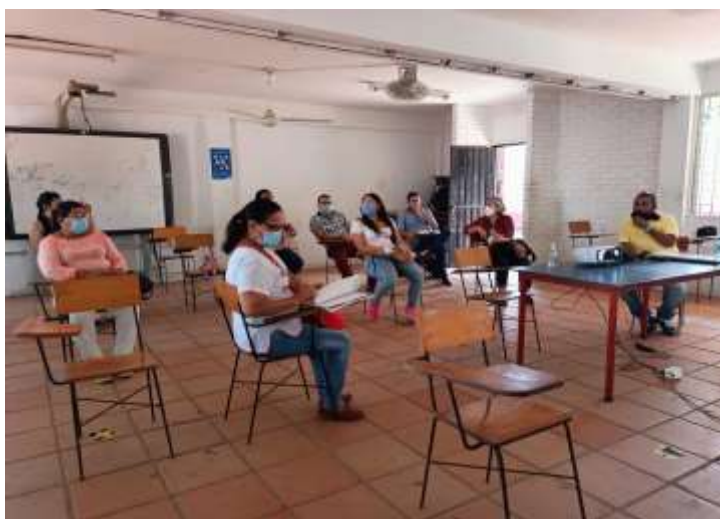
Reunión de Consejo directivo