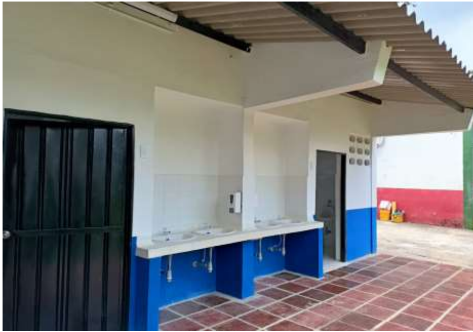
Adecuación de espacios y recuperación de áreas de importancia institucional