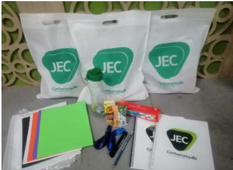
Jornada escolar complementaria COMBARRANQUILLA.