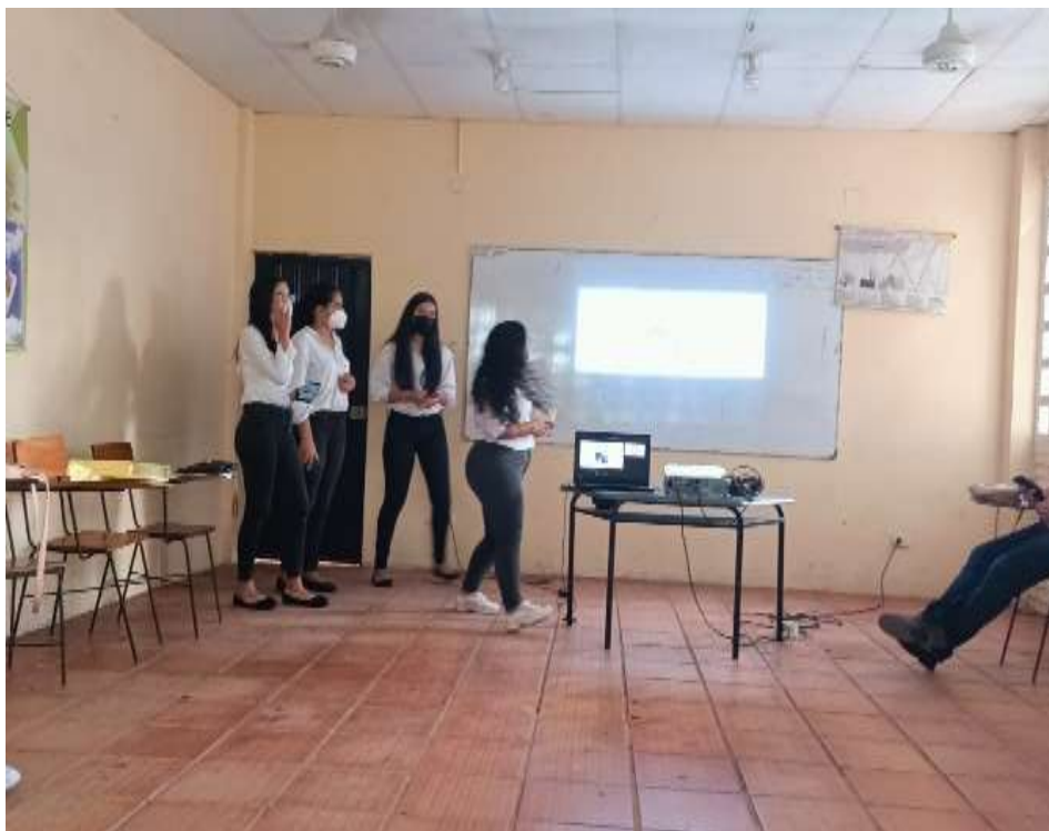
Proceso de Organización y seguimiento al programa de articulación con el Sena