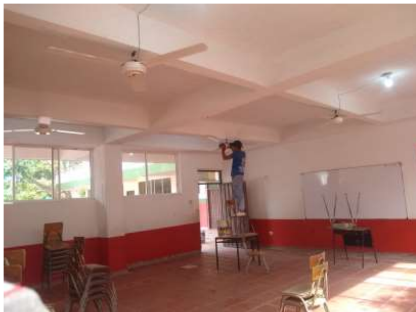
Reparaciones eléctricas y mantenimiento e instalación de equipos de ventilación.