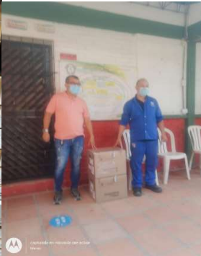
Equipos de cómputo