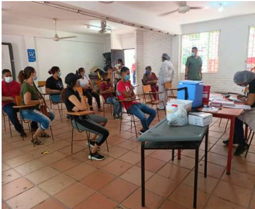
JORNADA DE VACUNACIÓN CONTRA EL COVID 19 PARA ESTUDIANTES Y PADRES DE FAMILIA