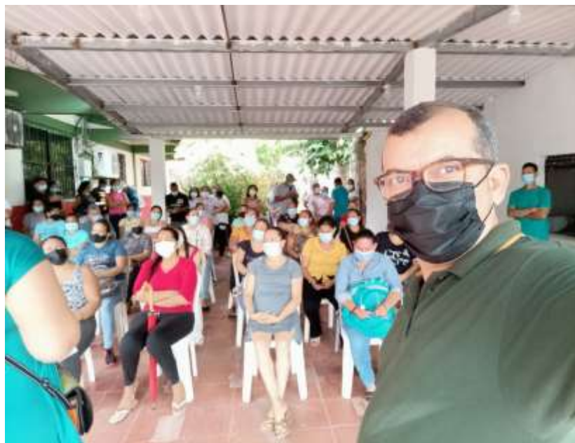
Interacción Con padres, madres y/o cuidadores de los estudiantes