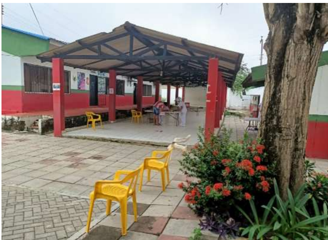
ENTREGA DE COMPLEMENTOS ALIMENTICIOS PROGRAMA PAE