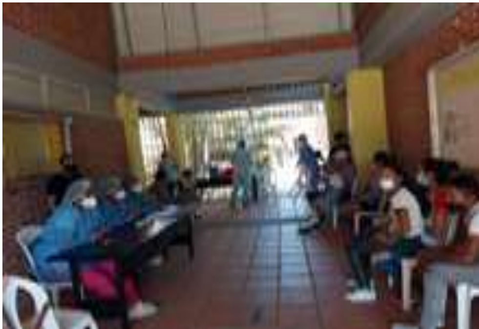
Jornadas de brigadas de salud