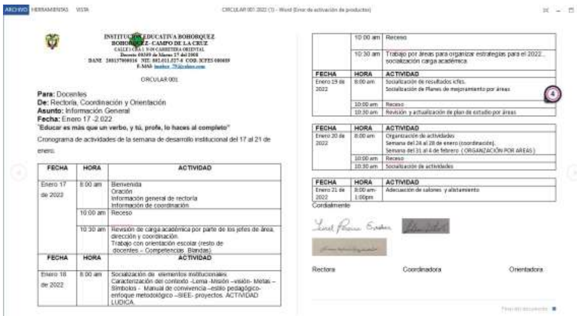
Evidencia 4 Circular para los docentes