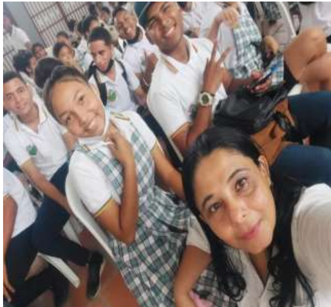
En el desarrollo de la 2da sesión del programa: Sin pelos en la lengua, para la prevención de embarazos a temprana edad