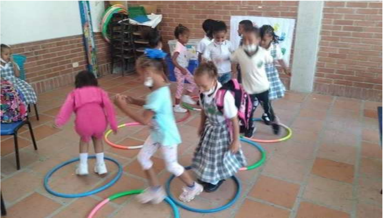
Estudiantes participando en actividades de convivencia “el respeto por el compañero”